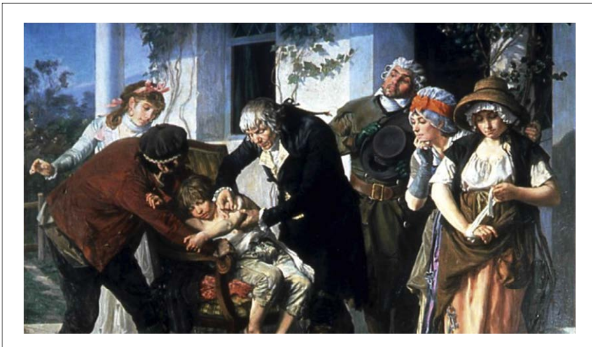
Figura 1. Gaston Melingue. “Edward Jenner (1749-1823) realizando la primera vacunación contra la viruela en 1796”