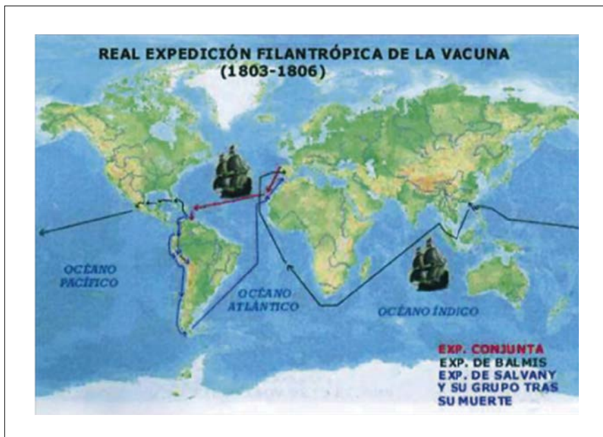
Figura 2. Mapa con las rutas seguidas por la Real Expedición Filantrópica de la Vacuna (1803-1806)

En México se establecieron numerosas juntas a lo largo de todo el Virreinato y Balmis con la fracción de la expedición a su cargo siguió hacia Manila en el navío Santa Bárbara con 26 niños mexicanos reclutados y que padecieron condiciones mucho peores de los embarcados en A Coruña (mareos, vómitos, fiebre, calor, tormentas y tifones durante la navegación). Desde Filipinas siguieron en otra embarcación a la colonia portuguesa de Macao desde donde se realizaron campañas de vacunación en territorio chino.